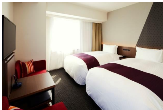
コーナーツインルーム（24㎡）

職人が削り出した木のパーツを組み合わせて作る「江戸組子の麻の葉文様 コースター作り」。