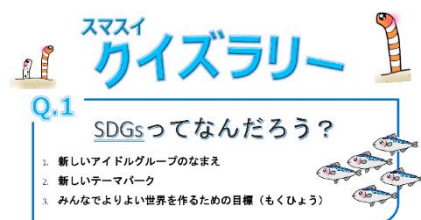
クイズラリー例題①