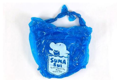
ポンチョのリメイクバッグ