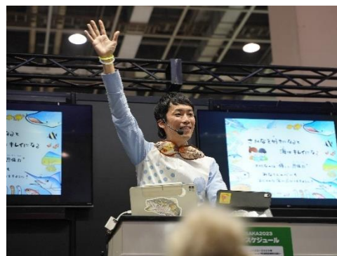
ステージイベント（イメージ）