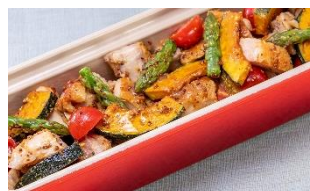
鶏肉と夏野菜の ハニーマスタード焼き