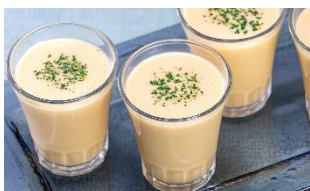
コールドコーンスープ