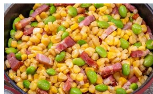
とうもろこしと枝豆の ベーコンソテー

その他、モルタデッラと夏野菜のパスタ / えのきとコーンのバジル風味ソテー / オクラと枝豆の塩麴ごま風味 / 茄子の冷やし煮浸し / 帆立と野菜の翡翠炒め / 夏野菜のラタトゥイユ 鶏肉のコンフィ / ちくわと胡瓜のワサマヨ和え / もち麦と野菜のマリネ など