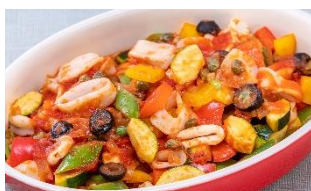
烏賊と野菜の軽い煮込み