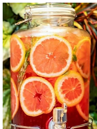
オリジナルピネガードリンク （イメージ）