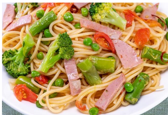
夏メニュー／モルタデッラと夏野菜のパスタ（イメージ）

当社のブランドステートメント「地域の価値で、未来を変えていく。」を具現化するホテルとして、2018年3月に誕生した価値体験型ホテル「インターゲートホテルズ」は、2023年3月にブランド誕生5周年を迎え、現在「焼きたてパンとごちそう野菜の朝ごはん」に5周年記念として地域限定スペシャルメニューをご提供しております。今回は夏だからこそ食べたい、地域の食材を取り入れた「ご当地朝カレー」をご用意。その他にも旬の野菜を存分に使用した夏限定メニューをラインナップいたしました。暑い夏を乗り切る、ここでしか食べられない朝食をお楽しみください。