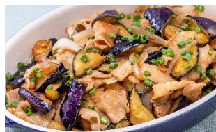
茄子と豚肉の ポン酢生姜