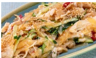
蒸し鶏とクラゲのサラダ