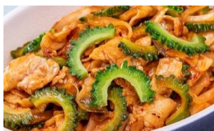
ゴーヤ入り 豚キムチ