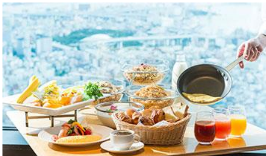
51階スカイラウンジ「エアシップ」イメージ