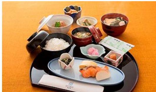
20階日本料理「磯風」イメージ