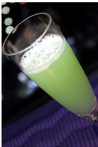
『エメラルドシャンパン』 ～マスクメロン～