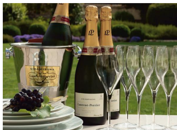
ロビーラウンジ ミザール 「プレミアム・シャンパンフリーフロー」

別館1階「ラウンジ・バー オールドサルーン 1934」では、オードヴル食べ放題と本格カクテルを含むフリードリンクがセットになった人気の「フリーヴルプラン」に、プレミアムな生ビール「プレミアムモルツ」やプレミアムなウイスキー「知多」などをお付けした「プレミアム・フリーヴルプラン」をお楽しみいただけます。