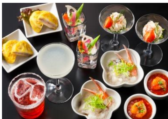
ラウンジ・バー オールドサルーン 1934 「プレミアム・フリーヴルプラン」