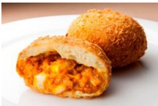
「海老とモッツァレラチーズのカレーパン」