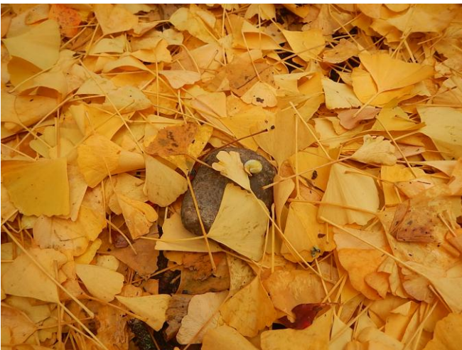
オハツキイチヨウ

〒398-0002 長野県大町市大町山田町 6665 番地 Tel. 0261-22-0377