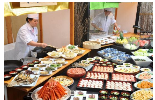
夕食バイキングイメージ

信州 B 級グルメコーナー、サラダコーナー、信州産コシヒカリや味噌・野菜・果物等、可能な限り信州産の食材を使い、料理だけでなく飲物も地産地消を心掛け、フードマイレージを削減、環境の負荷にも配慮します。デザートも充実、自分で巻き巻きできるソフトクリーム、ケーキ、フルーツ、コーヒー、紅茶、北アルプスの伏流水まで種類豊富です。