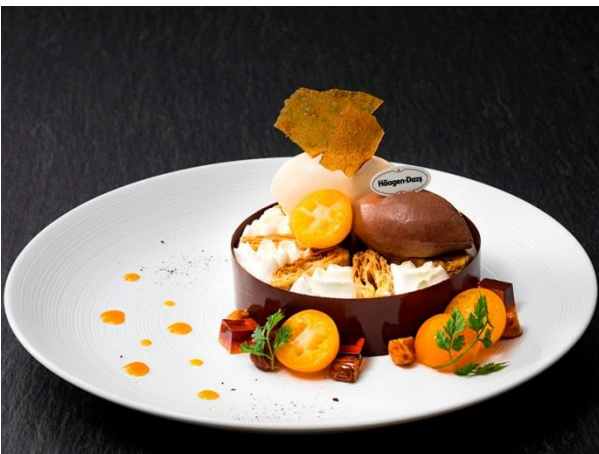
バニラと金柑のミルフィーユ仕立て

クリスピーチップチョコレートアイスクリームとナッツの食感が嬉しい魅惑的な一皿です。