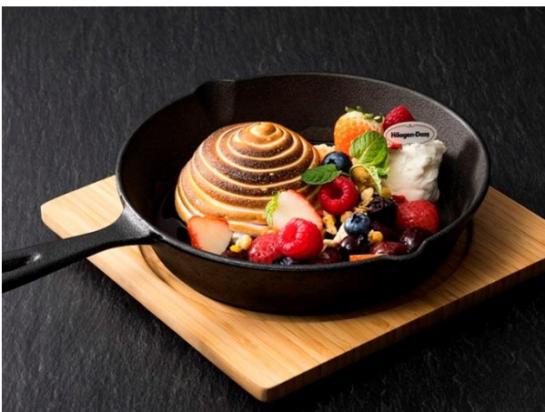
バニラのバイクドアラスカとチェリージュビリー

サクサクのパイ生地を合わせた新感覚のミルフィーユ。ミルクの味が濃いバニラアイスクリームとチョコレートアイスクリームを使用しました。