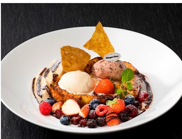
ジャンボバゲットのフレンチトースト 2種のアイスクリームと共に ¥1,200

ほうじ茶入りのホワイトチョコレート生地で仕上げたフォンダンショコラ。中からとほうじ茶のガナッシュが溶け出し、アイスクリームとの絶妙な味わいを生み出します。