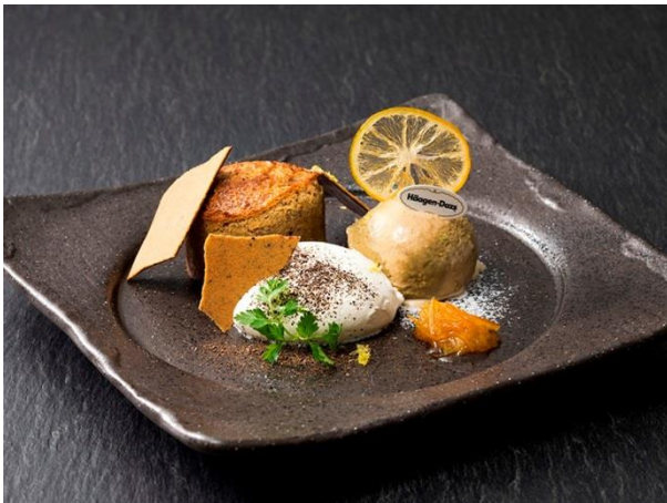
ほうじ茶のフォンダンショコラマイヤーレモンの香り ¥1,300