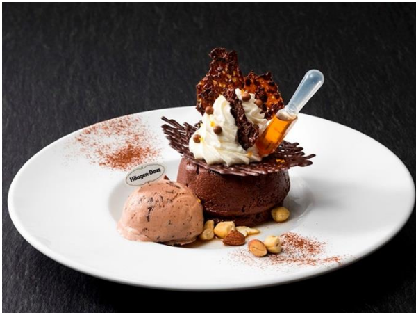
クリスピーチップチョコレートのショコラサバラン