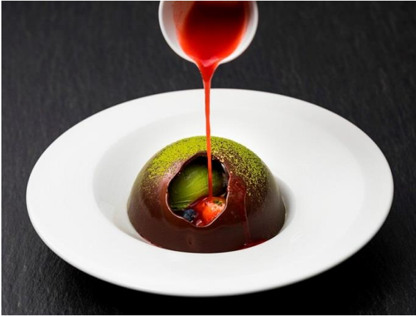
グリーンティーと温かい苺ソースのチョコレートドーム ¥1,200