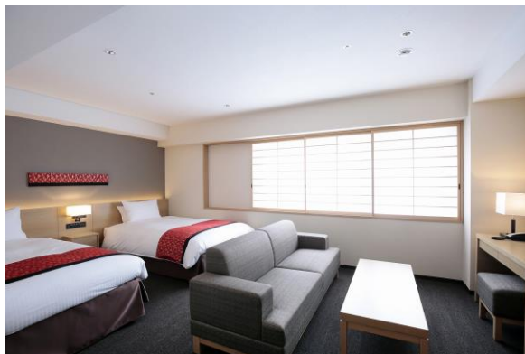
デラックスツインルーム