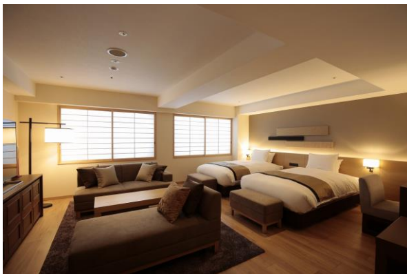
ジュニアスイートルーム

客室構成は 2 名様以上でのご利用を主体とし、コネクティングルームやトリプルルーム、フォースルームと、グループやご家族連れのお客様にも幅広くご利用いただけます。