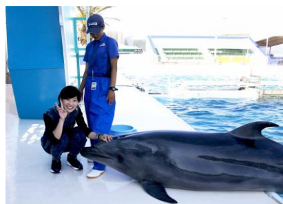
トレーナー体験でイルカとのふれあい