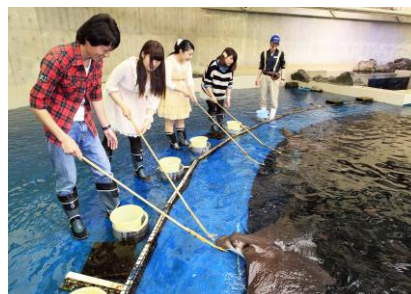
エイやサメへのエサやり体験