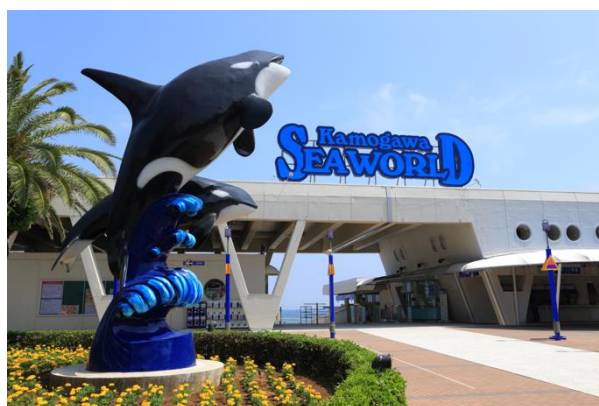
鴨川シーワールド