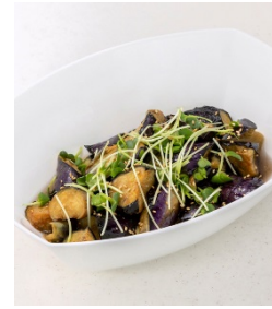
ナスの和風マリネ 胡麻風味