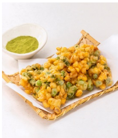
とうもろこしとアスパラガスのかき揚げ