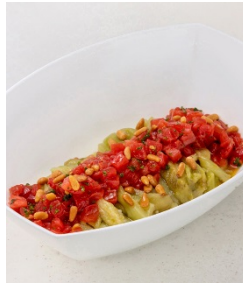
焼き茄子のイタリア風