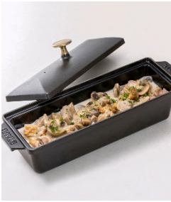
鶏肉とマッシュルームのクリーム煮 ローズマリー風味