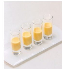
北海道コールドコーンスープ