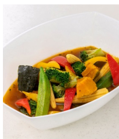
夏野菜の冷製スープカレー