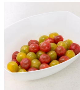
リコピンのハニーレモンマリネ