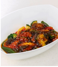
夏野菜の揚げ浸し和風味のジュレかけ