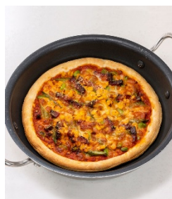
とうもろこしとアスパラガスのピッツァ