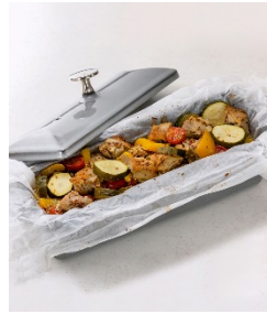
鶏肉とビタミン野菜の紙包み焼き ハニーマスタード風味

【INTERGATE HOTELS コンセプト】 公式 HP: https://www.intergatehotels.jp/