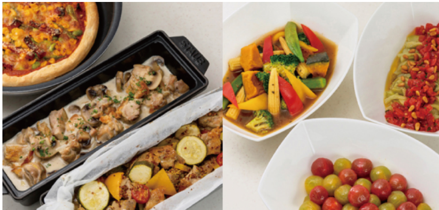
夏メニュー例(写真はイメージです)

夏バテなどにより食欲不振となりがちな夏の季節、スパイスを効かせた冷製スープカレーや夏野菜の彩り鮮やかなマリネやピクルスなど、お客様にお楽しみいただける朝食メニューが2019年6月15日(土)より登場。9月中旬ごろまで、朝から夏を堪能していただけます。