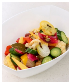
彩りの爽やかピクルス