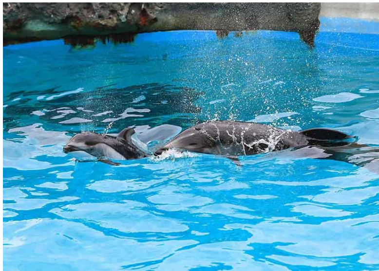
元気に泳ぐ親子(2019年6月25日撮影)