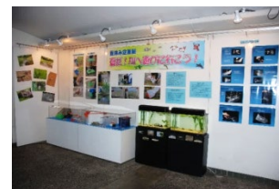
過去の展示の様子