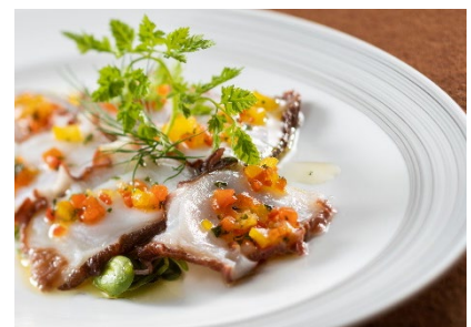
羅臼町産真蛸のカルパッチョ ガルシア風