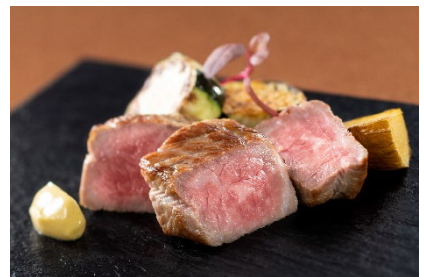
北海道産牛肉のステーキ