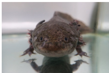
メキシコサラマンダー