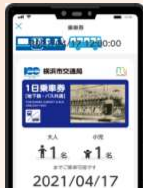
▲地下鉄・バス共通デジタル1日乗車券 (100周年記念デザイン)