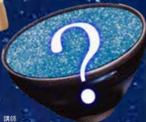
講師 丸山琴 (ヨンブンノサン代表)

お申込みは静嘉堂文庫美術館 HP「チケット予約」 ( https://www.e-tix.jp/seikado/ ) または右記 QR から *お問い合わせは toiawase@seikado.or.jp まで