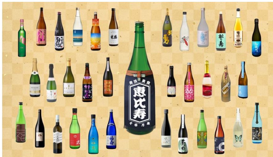
全国の日本酒蔵元 34 蔵、合計 100 種類以上の日本酒が利き酒できる

【公式イベントサイト】 https://event.oishiisake.jp/walk-ebisu2023/