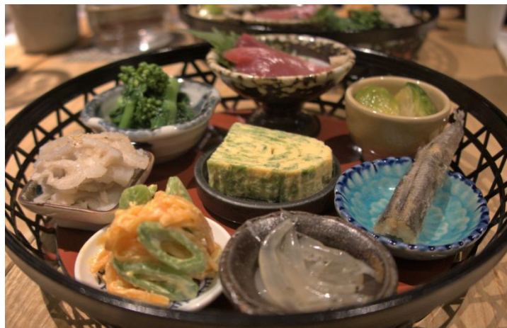
料理写真（イメージ）

酒 秀治郎 蕎麦と日本酒 八福寿家 麦酒庵 恵比寿店 魚見茶寮 ミズノリ 恵比寿 吉乃坐 ほの字 恵比寿店 YAOCHO-BAR EBISU 大魚 今日も大漁や 日本酒×ワイン ノンベエ エビス izakaya たろ 蕎麦前ごとう O'denbar うまみ 代官山 サリールズ 恵比寿サウナー えびす呑み場やました 恵比寿和顔 越後屋喜八郎 KAPPO R 恵比寿 立呑み 源太郎商店 洞窟おでん 庵狐 恵比寿店 あか牛精肉販売所 六角亭 串揚げと和食 代官山ひなた