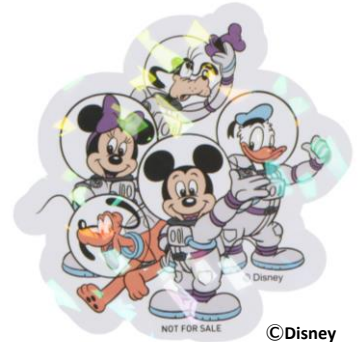
■ スペシャルステッカー