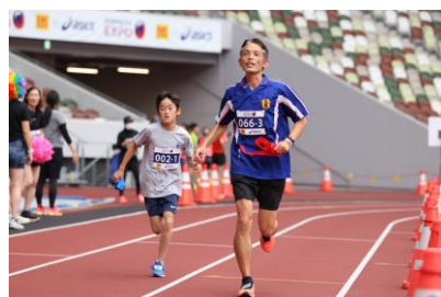
国立競技場のトラックでランニング