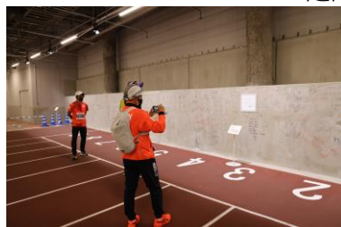
国立競技場周遊見学