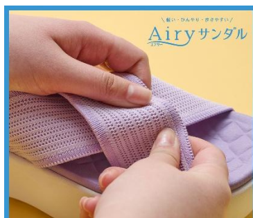
Point 01 やわらかい！