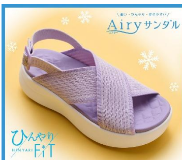
Point 03 ひんやり！