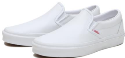
商品名：CLASSIC SLIP-ON カラー：(W.LOVERS)WH/WH サイズ：22.0cm~29.0cm 価格：¥8,250 (税込)