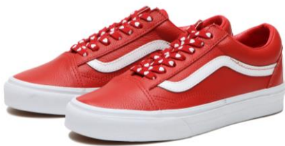
商品名：OLD SKOOL カラー：(W.LOVERS)R.RED サイズ：22.0cm~29.0cm 価格：¥11,000 (税込)