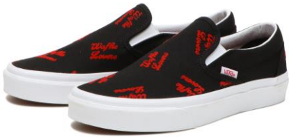
商品名：CLASSIC SLIP-ON カラー：(W.LOVERS)BK/WH サイズ：22.0cm~29.0cm 価格：¥7,700 (税込)