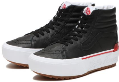
商品名：SK8-HI STACKED カラー：(W.LOVERS)BK/WH サイズ：22.0cm~29.0cm 価格：¥13,200 (税込)