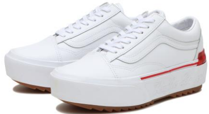
商品名：OLD SKOOL STACKED カラー：(W.LOVERS)WH/WH サイズ：22.0cm~29.0cm 価格：¥12,650 (税込)