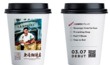
オリジナル紙カップ一例

また製品発売に先立ち、新製品をいち早く試飲体験いただける場として、ポップアップイベント「STORY OF THE REAL COFFEE OMOTESANDO」を3月2日（水）より期間限定でオープンします。5種類のブレンドのなかからお好きなブレンドをお選びいただき、挽きたて、淹れたてで、ポップアップイベントオリジナル紙カップで無料にて提供します。