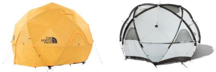
Geodome4(写真右はフライシートを外した状態)