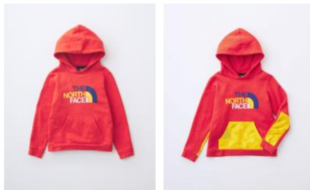
アップサイクル前 → アップサイクル後

WEB サイト： https://www.goldwin.co.jp/greenbaton/