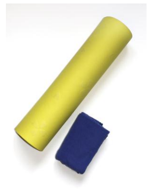
※一般的なヨガマットとの持ち運びサイズ比較