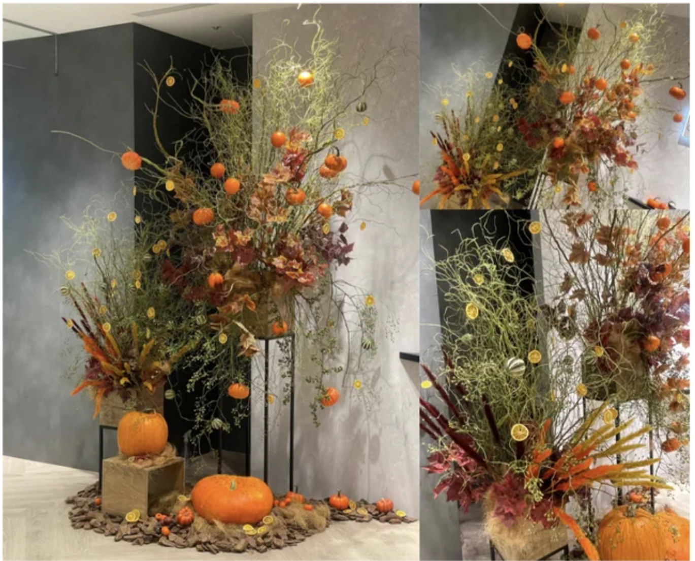
■ スポンサーチーム「愛媛FC」のイメージカラーに合わせたオレンジ×ハロウィンの演出