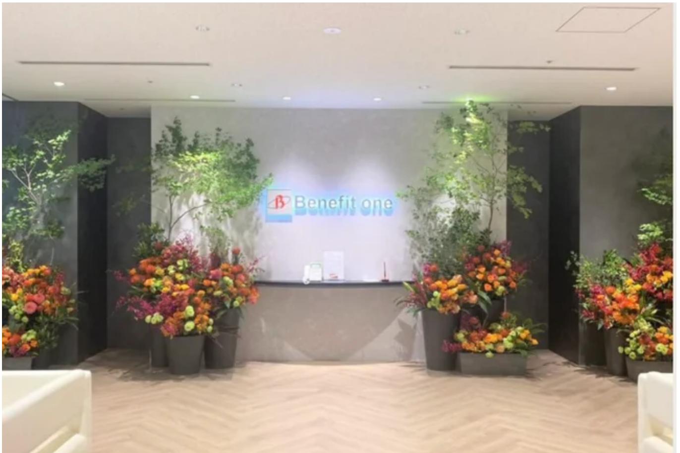
祝い花サービス『matomeru』_株式会社ベネフィット・ワン様_オフィスエントランス

～スポンサーチーム「愛媛FC」をイメージしたエントランス装飾などでCSR活動への相乗効果も～