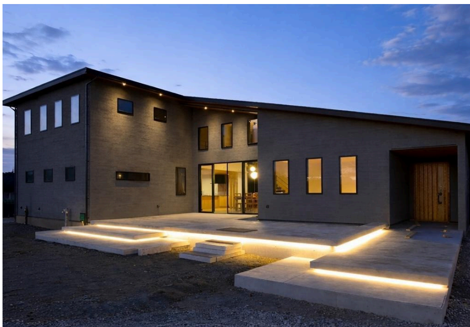
ベストオブデザイン 受賞作品：・ villa ・ 受賞店：フィアスホーム佐久平店

中でもベストオブデザイン賞は、外観デザイン部門、インテリア部門の上位作品の中から、各部門の評価にパッシブデザインの加点評価を加え総合的な判断により選出しています。