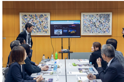
上) 表彰式 下) 職種別交流会