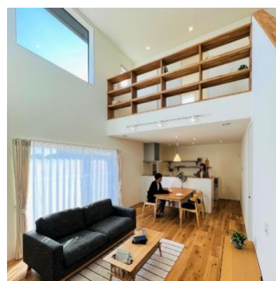
フィアスホーム彦根店 期間限定モデル(左)外観、(右)内観

フィアスホーム彦根店は、2013年にフィアスホームに加盟して以降、湖北エリアにて高气密高断熱+パッシブデザインの省エネで快適な住まいを提供してきました。今回オープンする新モデルハウスは、フィアスホームが提供する商品の中でもトップクラスの断熱性能を誇る「アリエッタDS(ディーエス)」で、西日本で初めての建設となります。