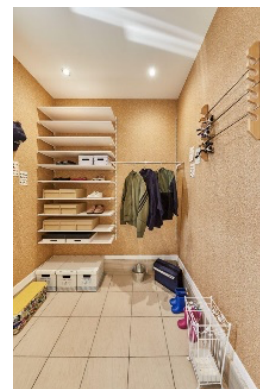
アイフルホーム神栖店 新モデルハウス内観 (左上)カウンターキッチン、(右上)リビング階段に設けられた壁一面のディスプレイ収納 (左下)テレワークスペース、(中下)ソックススペース、(右下)土間収納