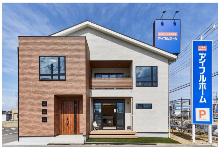
アイフルホーム神栖店新モデルハウス「FAVO for RELAX」外観