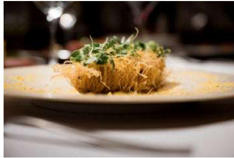
イタリアンレストラン「Takeru Quindici」