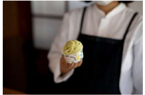
ジェラテリア & ベーカリー「Gelato & Bake SANTI」