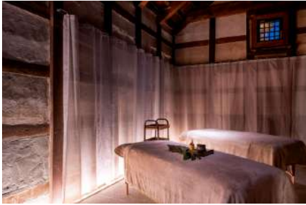
一ノ蔵 (エステ & BAR)