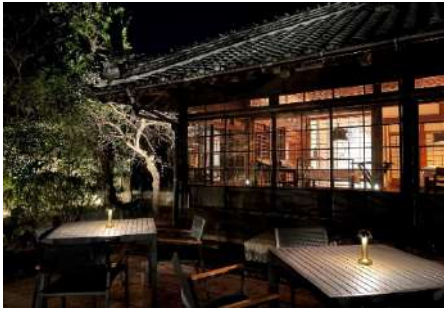
母屋 (レストラン, ベーカリー, ジェラテリア)