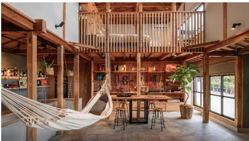
足摺の大自然を楽しむための一棟貸しの秘密基地

本館から徒歩1分の近隣にあった空き家をリノベーションした、TheMana Village初の別邸ヴィラ。世界一楽しい一棟貸し施設を目指し、 土佐清水の自然を「遊び散らかせる」 、キャンプグッズ、BBQアイテム、釣り具、サーフボード、シュノーケルグッズ、電動自転車、バギー、楽器、天体望遠鏡、DIYアイテムなどを完備。 まるで子供の頃の夢が全て詰まった秘密基地（BASE）のような施設にしました。