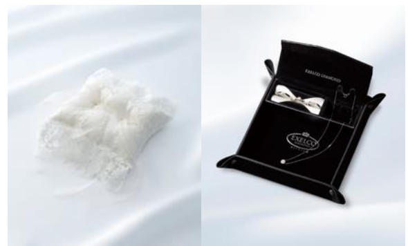
EXELCO 特製リングピロー/ボックス付きジュエリートレイ

③ マリッジリングをご成約頂いた方に、ヨーロッパの高級レースを使用した「EXELCO 特製リングピロー」または「ボックス付きジュエリートレイ」をプレゼントいたします。