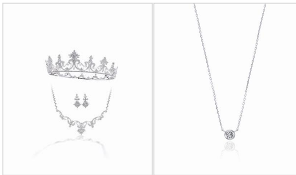
ダイヤモンドティアラ3点セット/プリミエールエクラ