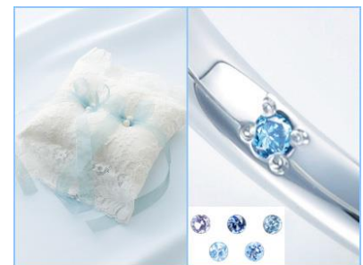
左:特製リングピロー | 右:シークレットストーン

そのうちのひとつが「サムシングブルー(Something blue)」です。「青」は幸せを呼ぶ色、花嫁の純潔や清らかさを表します。