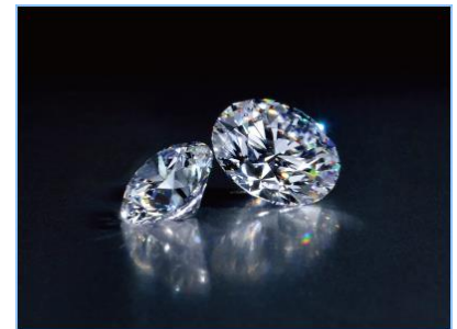
ダイヤモンドルース

トルコウスキー家7代目ジャン・ポール・トルコウスキーの監修のもと、特別に厳選されたアイディアラウンド ブリリアントカットのより高グレードのダイヤモンド をご用意いたします。