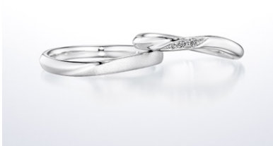
シャイニングフロー (結婚指輪)