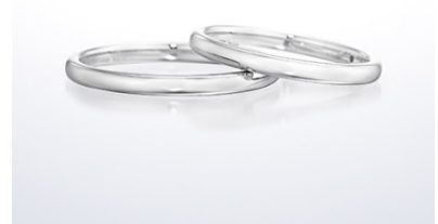
アリュール (結婚指輪)