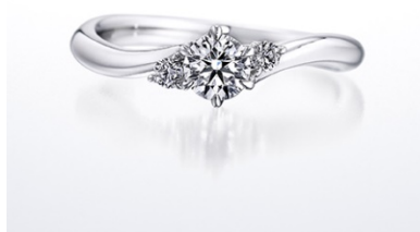
シャイニングフロー (婚約指輪)