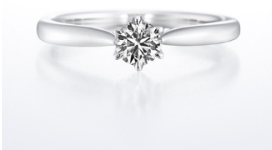
ホワイトリリー (婚約指輪)