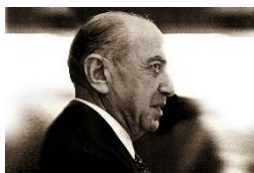
トルコウスキー家4代目 マーセル・トルコウスキー 「アイディアラウンドブリリアントカット」を発明した数学者