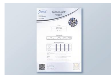
購入したダイヤモンドに輝きの評価がつく

ダイヤモンドの輝きを、世界中で基準を設けて評価できるように開発されたのが「サリネライト」というシステム。この歴史的な機器の開発に「美しい輝きの基準となるダイヤモンド」として使用されたのがエクセルコ ダイヤモンドのダイヤモンドです。