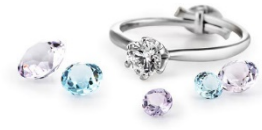
プロポーズリング (シルバー製)

※エンゲージリング成約特典のオリジナルスコープとプロポーズリングはどちらかお好きなほうをお選びいただけます。