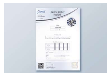
購入したダイヤモンドに輝きの評価がつく

エクセルコ ダイヤモンドのダイヤモンドは「サリネライト」で評価されるダイヤモンドの99%以上が最上位評価を獲得していることから、ダイヤモンド本来が持っている輝きを存分に堪能できます。