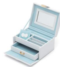
ジュエリーケース