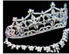
東京都中央区銀座4丁目の貴金属店で07年6月、約2億相当のティアアラ(王冠の髪飾り)強奪