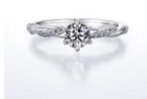
タイムレスラブ (婚約指輪)