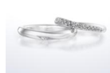
アマリー (結婚指輪)