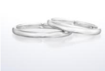
アリュール (結婚指輪)