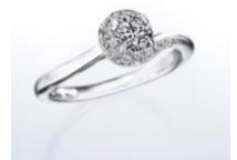
イルユミティ (婚約指輪)