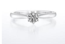
ホワイトリリー (婚約指輪)