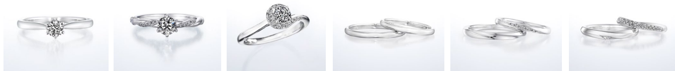
ホワイトリリー (婚約指輪)