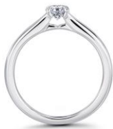
新作：Rayon de Lumière (レヨン ド リュミエール)