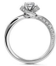
Lien Infini (リアンフィニ)