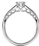
Le Voile (ル ヴォワール)