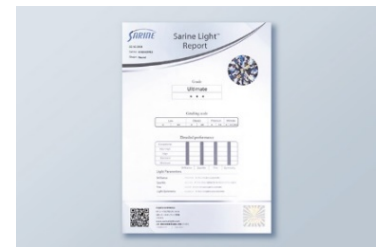
購入したダイヤモンドに輝きの評価がつく

エクセルコ ダイヤモンドのダイヤモンドは「サリネライト」で評価されるダイヤモンドの99%以上が最上位評価を獲得していることから、ダイヤモンド本来が持っている輝きを存分に堪能できます。