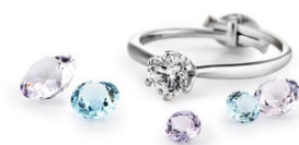
プロポーズリング(シルバー製)

※アルティメイトダイヤモンドシライシは「27th Anniversary Fair」対象外店舗となります。