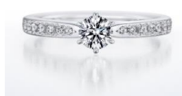
【NEW】婚約指輪 オーキッド