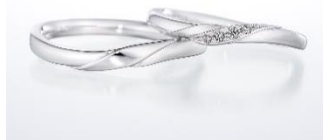
【NEW】結婚指輪 ブライト ボヤージュ