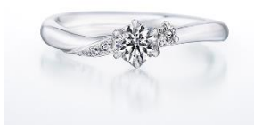
【NEW】婚約指輪 ブライト ボヤージュ