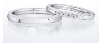
【NEW】結婚指輪 オーキッド