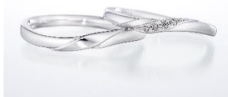
結婚指輪 【ブライト ボヤージュ】